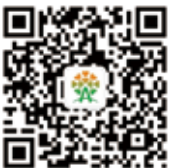
扫描二维码，关注安利公益基金会