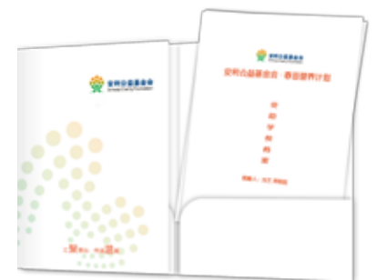
向重点捐方提供《项目进展报告》等沟通材料